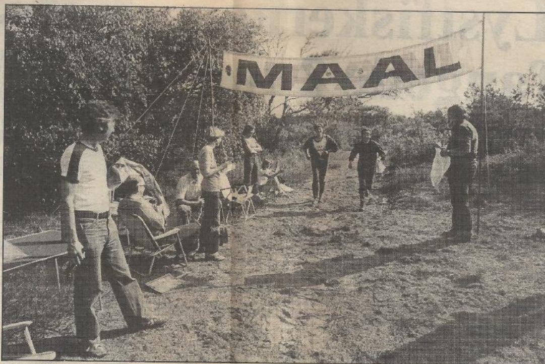
Målet for alle tre løb var ved Østerklit Camping, og her løber to medlemmer af Silkeborg Orienteringsklub i mål.